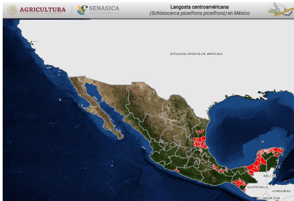
Figura 1. Estados en los que se tiene presencia de langosta al mes de octubre del 2020.

En el mes de octubre del 2020 mediante la acción de exploración se atendió una superficie de 52,633 hectáreas, de éstas se muestrearon 7,541.5 en los estados de Campeche, Chiapas, Hidalgo, Oaxaca, San Luis Potosí, Tabasco, Tamaulipas, Veracruz y Yucatán, identificando la presencia de la langosta en estado biológico de ninfa y adulto, tanto gregarios como solitarios, en el caso de ninfas se encontraron en instar de N1 al N5, se registró un promedio de infestación de 60 individuos/100 m 2 .