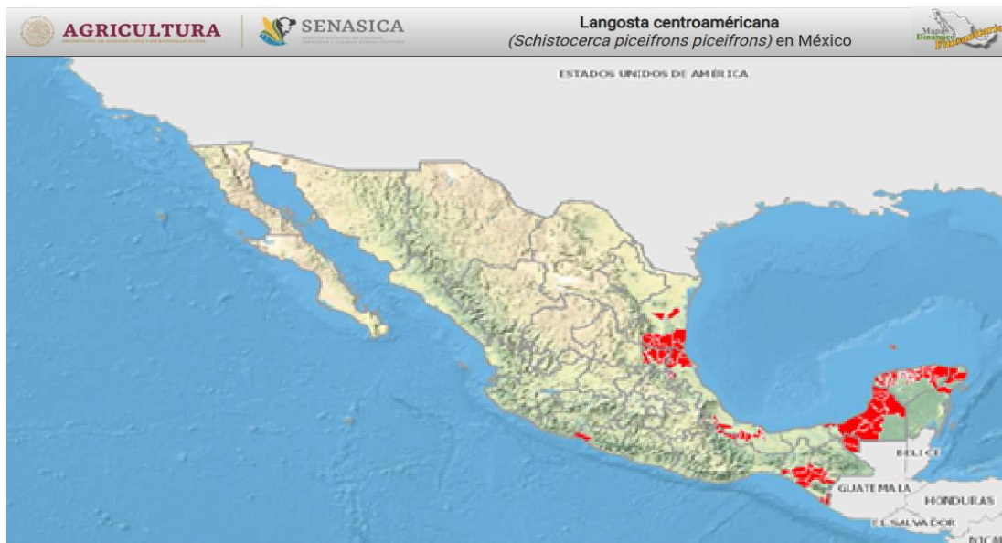
Figura 1. Estados en los que se tiene presencia de langosta al mes de agosto del 2020.

Durante el mes de agosto del 2020 mediante la acción de exploración se atendió una superficie de 63,876.1 hectáreas, de éstas se muestrearon 13,948.6 en los estados de Campeche, Chiapas, Hidalgo, Oaxaca, San Luis Potosí, Tabasco, Tamaulipas, Veracruz y Yucatán, identificando la presencia de la langosta en estado biológico de ninfa y adulto, tanto gregarios como solitarios, en el caso de ninfas se encontraron en instar de N1 al N5, se registró un promedio de infestación de 40.5 individuos/100 m 2 .