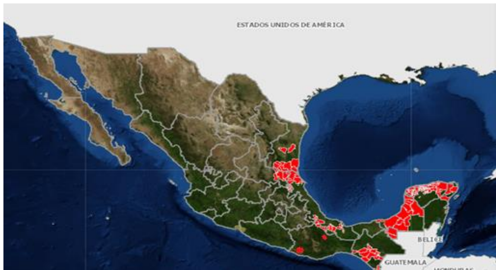
Figura 1. Estados en los que se tiene presencia de langosta al mes de junio del 2020.

En el mes de junio del 2020 mediante la acción de exploración se atendió una superficie de 29,911 hectáreas, de éstas se muestrearon 2,438 en los estados de Campeche, Chiapas, Hidalgo, Oaxaca, Quintana Roo, San Luis Potosí, Tabasco, Tamaulipas, Veracruz y Yucatán, identificado la presencia de la langosta en estado biológico de ninfa y adulto, tanto gregarios como solitarios, en el caso de ninfas se encontraron en instar de N2 al N4, con niveles promedio de infestación variables entre 0.2 a 30 ninfas/100 m 2 y los adultos, se registró un promedio de infestación de 10 individuos/100 m 2 .