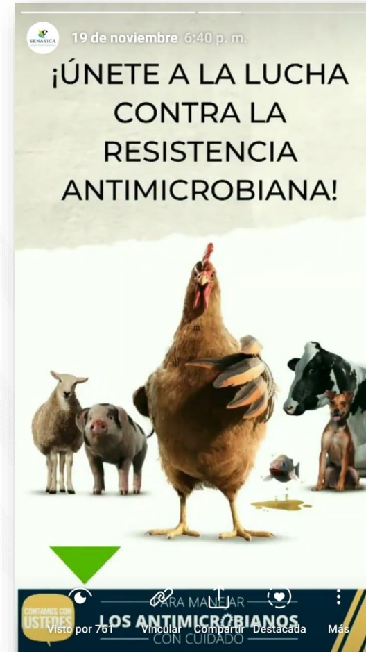
Vista por 761 personas