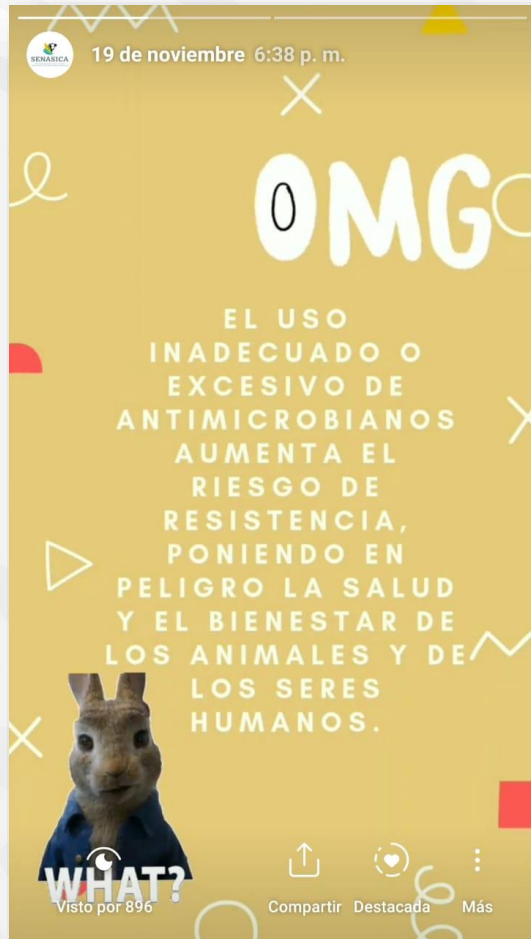
Vista por 896 personas