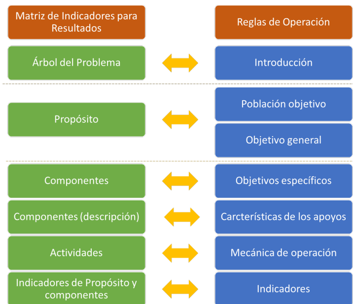
Figura 2. Alineación de la Matriz de Indicadores para Resultados (MIR) y las Reglas de Operación (ROP)

Lo anterior, sin lugar a dudas, se asocia a la deficiente construcción técnica de los documentos normativos, particularmente de las reglas de operación, las cuales se configuran a partir de la formulación de la Matriz de Indicadores para Resultados, que a su vez se sustenta en la aplicación de la metodología del Marco Lógico, donde se definen la población objetivo, los objetivos específicos, la caracterización de los apoyos, los mecanismos de operación y los indicadores (Véase Figura 2).