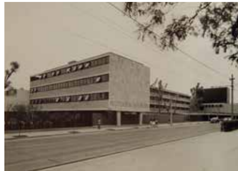
VISTA PANORÁMICA DEL CENTRO DE SEGURIDAD SOCIAL TEPEYAC

Foto: Autor desconocido, hacia 1960. UNAM. Archivo de Arquitectura Mexicana y Cultura Visual del siglo XX. Fondo Alejandro Prieto Posada. En proceso de catalogación.