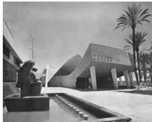
TEATRO AL AIRE LIBRE DE LA PAZ, BAJA CALIFORNIA SUR

Foto: Autor desconocido, hacia 1960. UNAM. Archivo de Arquitectura Mexicana y Cultura Visual del siglo XX. Fondo Alejandro Prieto Posada. En proceso de catalogación.