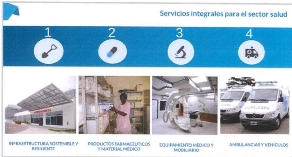
Figura 1. Servicios integrales para el sector salud

Entre las prioridades del plan estratégico de la UNOPS para la Región de América Latina y el Caribe, dentro de los servicios integrales para el sector salud, se encuentra la gestión de adquisiciones de medicamentos.