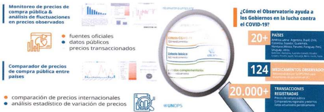
Figura 2. Observatorio Regional de Precios de Medicamentos

El Observatorio Regional de Precios de Medicamentos de la UNOPS es una plataforma innovadora que promueve el uso y reutilización de datos públicos para análisis comparativo, mediante el acceso a información veraz de precios de compras institucionales 5 registradas por fuentes oficiales en 21 países de referencia, incluyendo a los Estados Unidos Mexicanos. UNOPS ha abierto el acceso a la base de datos de precios de medicamentos para tratamiento de la enfermedad originada por el virus SARS-CoV-2 (Covid-19) a los Gobiernos y sociedad civil para promocionar la transparencia en las compras de emergencia y contribuir a los esfuerzos de lucha contra la corrupción en la compra de medicamentos.