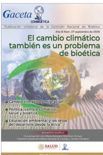
Gaceta No. 37