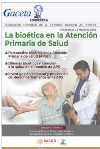
Gaceta No. 35