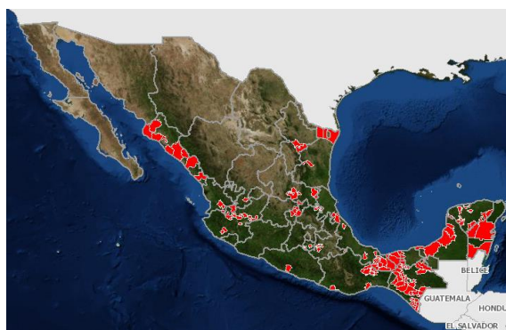
Figura 2. Estatus fitosanitario de Leprosis en México. Fuente: Mapa dinámico fitosanitario, disponible en: http://sinavef.senasica.gob.mx/mdf/ (Fecha de consulta: 04/06/2020).