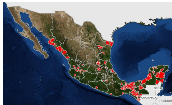
Figura 2. Estatus fitosanitario de Leprosis en México.