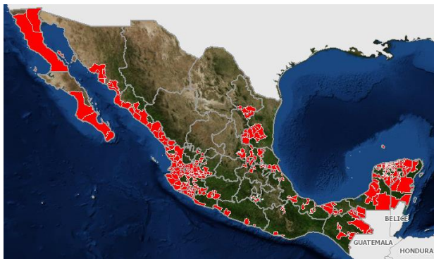
Figura 1. Estatus fitosanitario del Huanglongbing en México.

El Huanglongbing (HLB) se ha detectado en 351 municipios de las 25 Entidades de México, de los cuales 292 son consideradas cítrícolas, lo que representa el 40% del total de los que cuentan con este cultivo en el país, el resto de los municipios con detecciones sólo cuentan con plantas de cítricos con diagnóstico positivo en áreas urbanas, asimismo, se han diagnosticado psíldos positivos a Candidatus Liberibacter asiaticus en 162 municipios (123 son cítrícolas). Se estima que la superficie comercial con presencia de HLB es del 26% con relación a la superficie nacional (602,310 hectáreas aproximadamente). Por otro lado, se ha detectado la Leprosis en 19 estados, así como CTV - raza severa en Veracruz y Mosca prieta en 13 entidades.