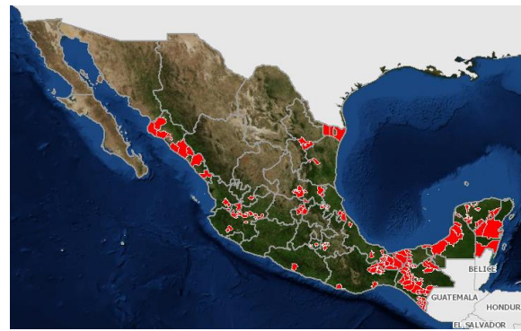
Figura 2. Estatus fitosanitario de Leprosis en México.