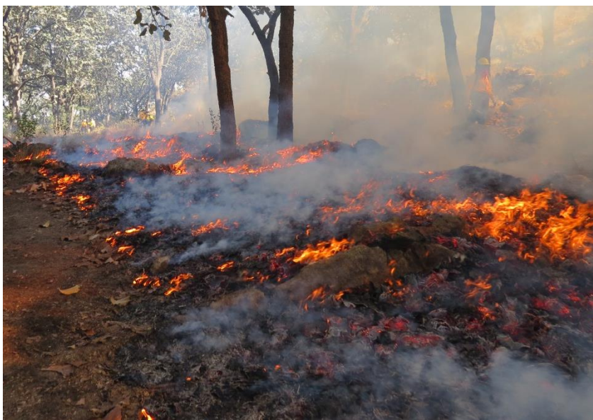
Imagen de una quema agrícola

1.- Llenar el formato que aparece en el Anexo 1, el cual debe ser entregado por el dueño del terreno a la autoridad municipal con copia a la autoridad agraria local, con 15 días de anticipación a la fecha en que se planea realizar la quema.