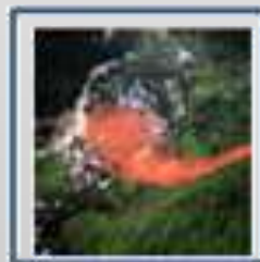
Inestabilidad de laderas, los flujos, los caídos o derrumbes,