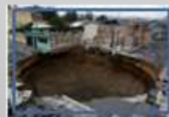
Hundimientos, subsistencia y agrietamientos