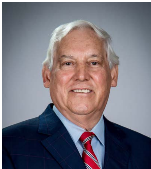
Dr. Víctor Manuel Villalobos Arámbula Secretario de Agricultura y Desarrollo Rural

La distribución y abasto de alimentos sanos, inocuos y de calidad es una prioridad estratégica. La promoción e impulso de iniciativas orientadas a este propósito contribuye a la seguridad nutricional en el país, asunto trascendental que está bajo la responsabilidad del sistema integrado por Seguridad Alimentaria Mexicana (SEGALMEX), DICONSA, S.A. de C. V. y LICONSA, S.A. de C.V., que a través de una perspectiva de integralidad de la política alimentaria contribuye al bienestar de la población que vive en condiciones de pobreza y marginación.