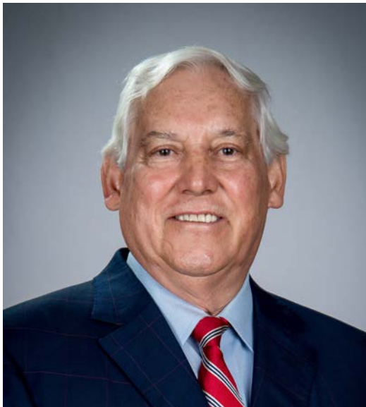
Dr. Víctor Manuel Villalobos Arámbula Secretario de Agricultura y Desarrollo Rural

El abasto de leche en las localidades rurales y de alta y muy alta marginación contribuye al mejoramiento nutricional de la población en condiciones de pobreza alimentaria en estas zonas y territorios. LICONSA S.A. de C.V., organismo sectorizado a la Secretaría de Agricultura y Desarrollo Rural, contribuye a este propósito estratégico.