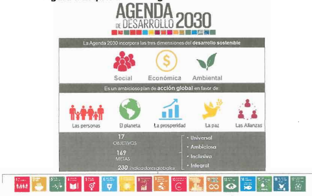
Figura 1. Esquema de la Agenda de Desarrollo 2030

La transición de los ODM a los ODS no constituye el término de un período, sino la redefinición de nuevos objetivos con características que implican un mayor alcance.