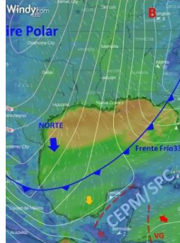
2100 hrs del 31/01/2021