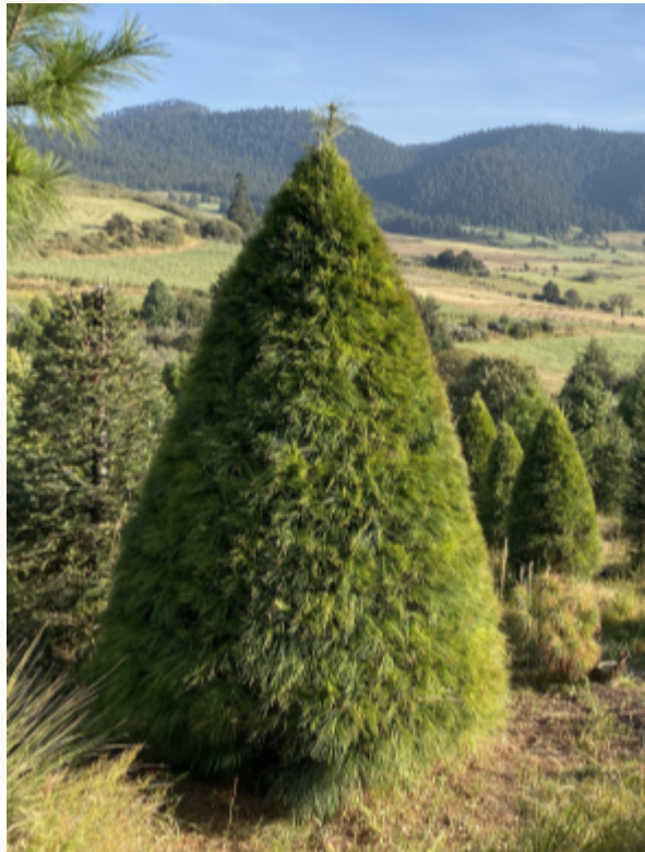
Pino ( Pinus ayacahuite ) Turno: 5 - 8 años