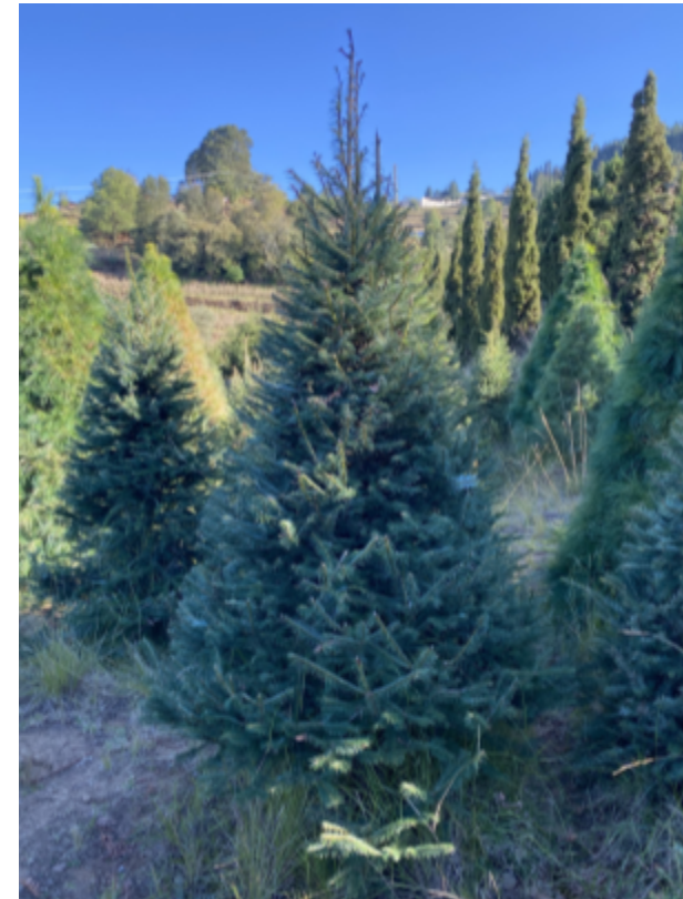
Abeto ( Pseudotsuga menziessii ) Turno: 8 - 10 años