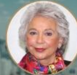
Dra. Olga Sánchez Cordero Secretaria de Gobernación