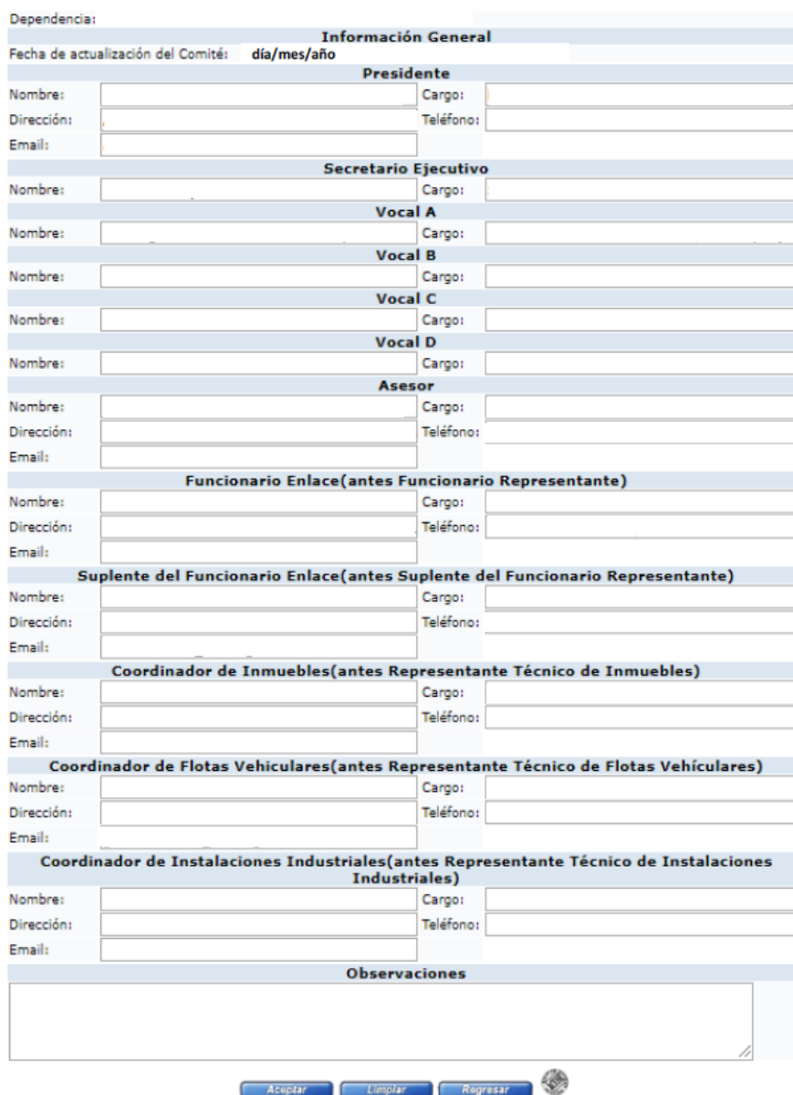
Figura 5. Pantalla de datos de Comité.

Paso 4. Seleccione la opción de COMITÉ INTERNO (AGREGAR) , con lo cual aparecerá la pantalla de la Figura 5 (ejemplo ilustrativo); en esta pantalla, proporcione todos y cada uno de los datos requeridos de los funcionarios que integrarán el Comité de su DyE. Al finalizar, seleccione el botón Aceptar .