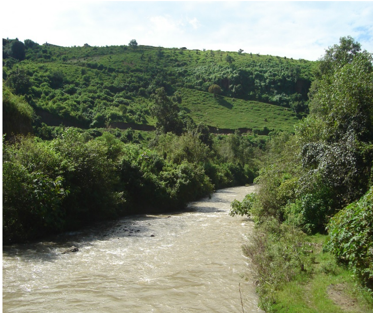
Figura 1. Cauce en su estado natural.

otras actividades se han ido intensificando exponencialmente a lo largo de la historia, llegando en la actualidad a un deterioro alarmante que sigue poniendo en peligro los ecosistemas acuáticos y ribereños, así como la calidad de vida y la seguridad de las localidades contiguas a las riberas.