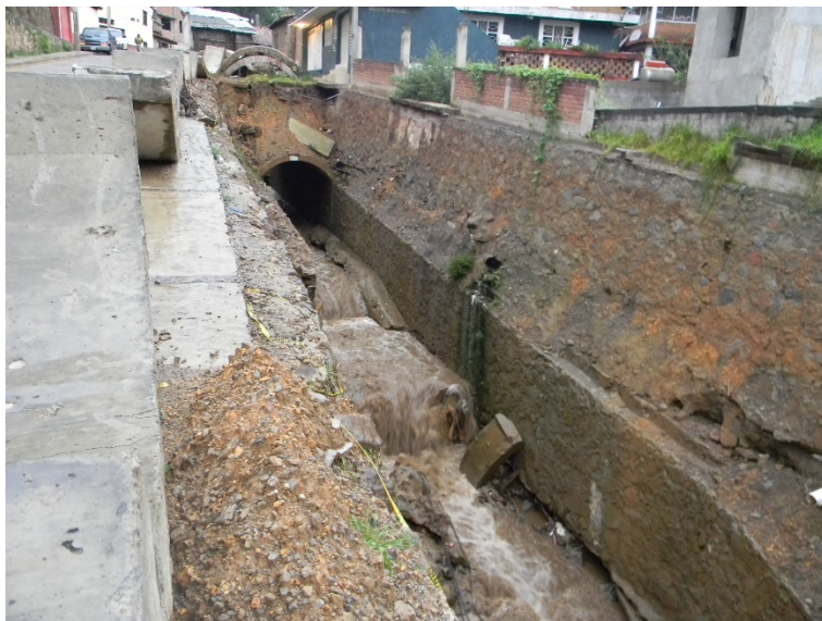
Figura 2. Cauce estrangulado y embovedado.

Teniendo en cuenta la importancia de los cauces y sus riberas por sus funciones, y las consecuencias de los efectos negativos de las prácticas humanas en ellas,