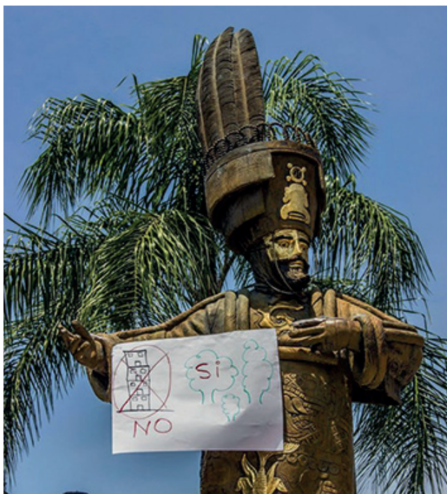
Protesta contra los proyectos inmobiliarios en el Predio Los Venados, municipio de Jiutepec, Morelos.