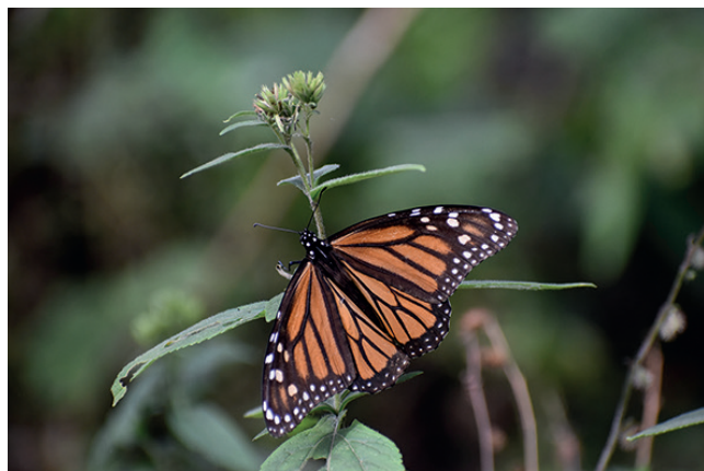
Mariposa monarca en el Santuario El Rosario, Michoacán.