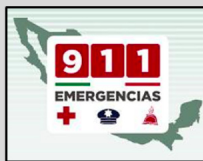
En caso de emergencia marca al 911