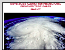
Enlace Manual SIAT-CT SINAPROC