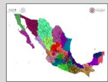
REGIONALIZACIÓN División de tu estado

Validez del boletín: domingo, 20 de septiembre de 2020 / 11:00 h