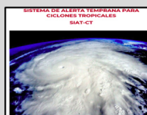
Enlace Manual SIAT-CT SINAPROC