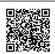
Infografía CENAPRED: "Qué hacer en caso de inundación"