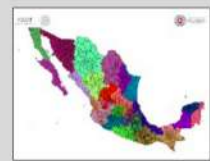
REGIONALIZACIÓN División de tu estado

Validez del boletín: jueves, 27 de agosto de 2020 / 11:00 h