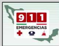
En caso de emergencia marca al 911