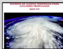
Enlace Manual SIAT-CT SINAPROC