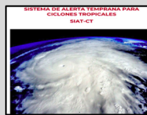
Enlace Manual SIAT-CT SINAPROC