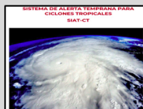
Enlace Manual SIAT-CT SINAPROC