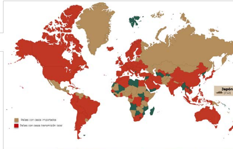
Distribución global de casos confirmados de COVID-19 por SARS-CoV-2 por laboratorio al día 21 de marzo de 2020.