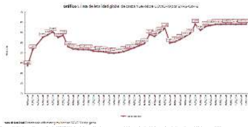
Fuente: OMS Información actualizada 03/03/2020. Con información de casos graves del Centre for Health Protection de Hong Kong al 03 de marzo 2020

**Se reportan 6,806 casos graves. Debido a cambios en la clasificación de OMS y a los datos que se reportan actualmente por cada país no es posible calcular la gravedad de la enfermedad.