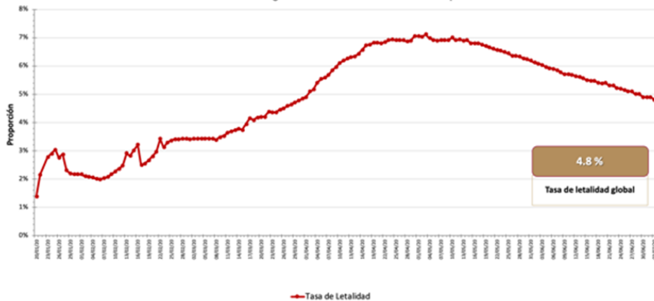
Gráfico 2. Tasa de letalidad* global de casos nuevos de COVID-19 por SARS-CoV-2