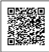
Infografía CENAPRED: "Qué onda con el calor"