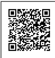
Infografía CENAPRED: "Qué onda con el calor"