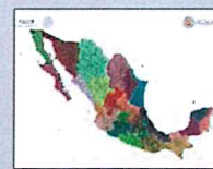
REGIONALIZACIÓN División de tu estado

Validez del boletín: lunes, 10 de agosto de 2020 / 23:00 h