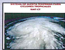
Enlace Manual SIAT-CT SINAPROC