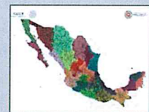
REGIONALIZACIÓN División de tu estado

alidez del boletín: domingo, 9 de agosto de 2020 / 23:00 h