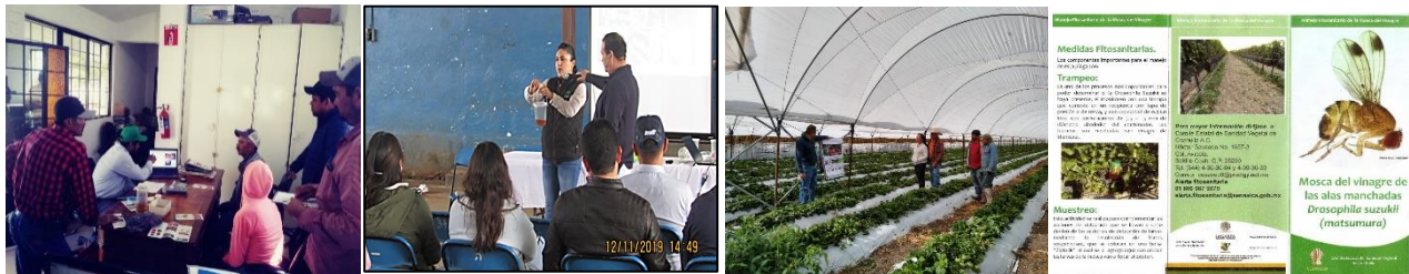
Figura 4. Pláticas de capacitación a productores y trípticos elaborados.

Se implementaron 4 supervisiones para verificar el cumplimiento de las actividades fitosanitarias y detectar áreas de oportunidad.