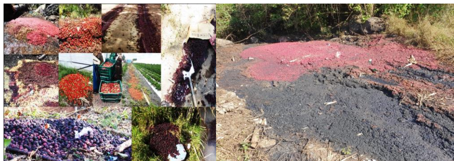
Figura 3. Actividades de recolección y destrucción de frutos

Con la finalidad de combatir los focos de infestación de la plaga, se realizó la instalación de 55 estaciones cebo y el recebado de ocho de estas, como una forma de trapeo masivo en área marginal. Dentro de las acciones de control mecánico se realizó la colecta y destrucción de 308.1 kg de fruta hospedante de la plaga (Fig. 3).