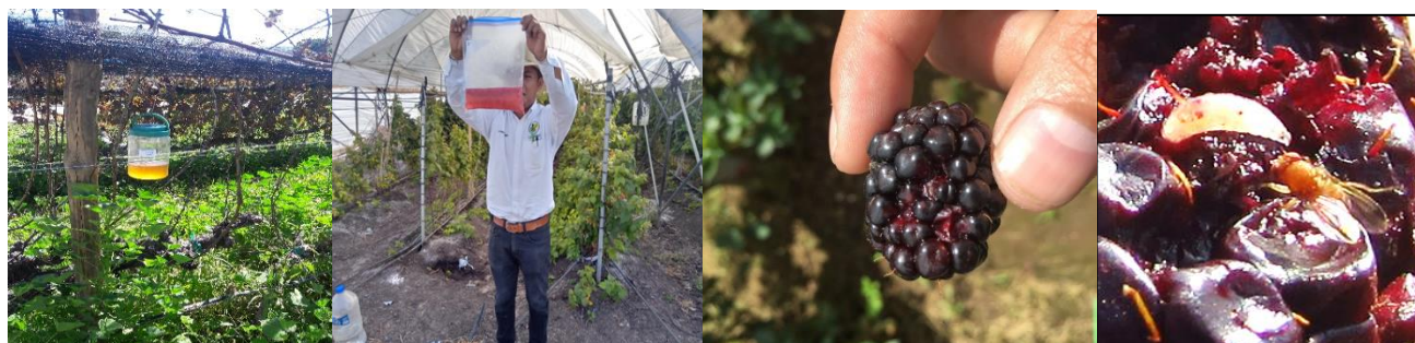
Figura 2. Actividades de monitoreo.

Se instalaron 1,192 trampas artesanales con vinagre de manzana, las cuales se revisaron 4,021, veces. De manera complementaria se realizó muestreo de 158.03 kg de fruta hospedante de la plaga (Fig. 2).