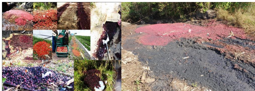
Figura 3. Actividades de recolección y destrucción de frutos

Con la finalidad de combatir los focos de infestación de la plaga, se realizó instalación de ocho estaciones cebo. Dentro de las acciones de control mecánico se realizó la colecta y destrucción de 32.39 kg de fruta hospedante de la plaga (Fig. 3).