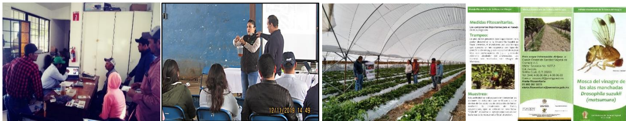
Figura 4. Pláticas de capacitación a productores y trípticos elaborados.

Se implementaron cinco supervisiones para verificar el cumplimiento de las actividades fitosanitarias y detectar áreas de oportunidad.