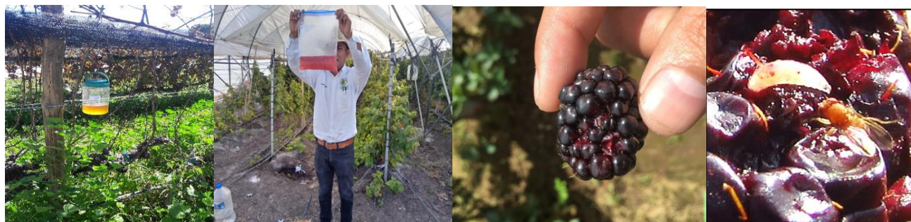
Figura 2. Actividades de monitoreo.

Se instalaron 1,192 trampas artesanales con vinagre de manzana, las cuales se revisaron 2,890 veces. De manera complementaria se realizó muestreo de 156.44 kg de fruta hospedante de la plaga (Fig. 2).