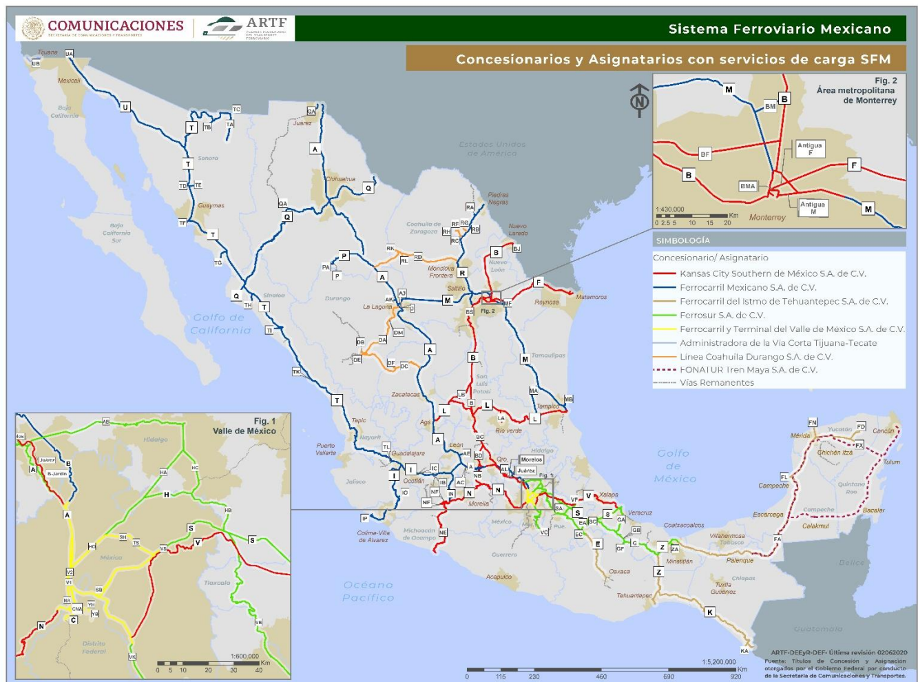
Figura 1. Mapa del Sistema Ferroviario Mexicano.

Actualmente, los concesionarios y asignatarios que brindan el servicio de transporte de carga en el SFM son: Kansas City Southern de México, S.A. de C.V. (KCSM), Ferrocarril Mexicano, S. A. de C. V. (Ferromex), Ferrosur, S. A. de C. V. (Ferrosur), Ferrocarril y Terminal del Valle de México (Ferrovalle), Línea Coahuila Durango, S. A. de C. V. (LCD), Ferrocarril del Istmo de Tehuantepec, S. A. de C. V. (FIT) y la Administradora de la Vía Corta Tijuana-Tecate, S. A. de C. V. (Admicarga). En la Figura 1 se muestran la ubicación espacial de las vías concesionadas y asignadas para el movimiento de carga en el territorio nacional.