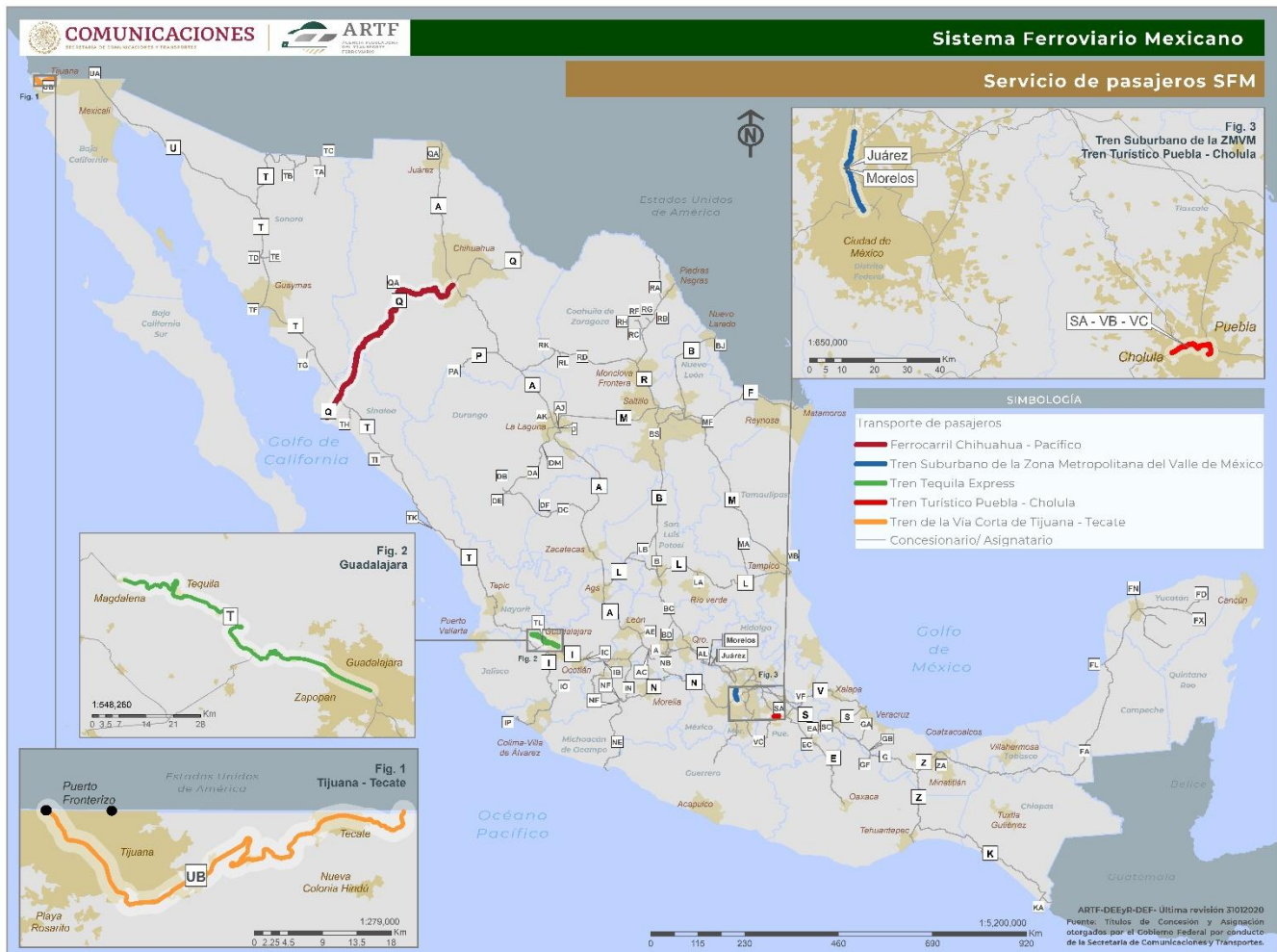
Figura 3. Mapa de rutas del transporte ferroviario de pasajeros.

El SFM cuenta con cinco servicios de pasajeros: el Tren Suburbano de la Zona Metropolitana del Valle de México (concesión a Ferrocarriles Suburbanos S. A. de C. V.), el Tren Turístico Puebla-Cholula (asignación al Estado de Puebla), el Ferrocarril Chihuahua-Pacífico (concesión a Ferrocarril Mexicano, S. A. de C. V.), el Tren Tequila Express (asignación al Estado de Jalisco) y el Tren de la Vía Corta Tijuana-Tecate (asignación al gobierno de Baja California). En la Figura 3 se muestra la ubicación espacial de las rutas de pasajeros en el territorio nacional para cada uno de estos servicios.