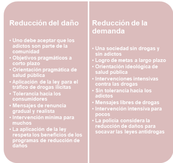
Fig. 1. Comparación entre la visión del enfoque de reducción de daños y de reducción de la demanda.

El enfoque de reducción de daños enfatiza la relevancia de programas orientados a generar alternativas que permitan minimizar riesgos para el consumidor (Oro & Gómez, 2013).