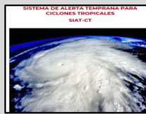
Enlace Manual SIAT-CT SINAPROC