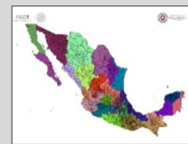
REGIONALIZACIÓN División de tu estado

Validez del boletín: domingo, 7 de junio de 2020 / 05:00 h