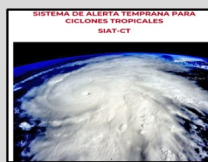
Enlace Manual SIAT-CT SINAPROC