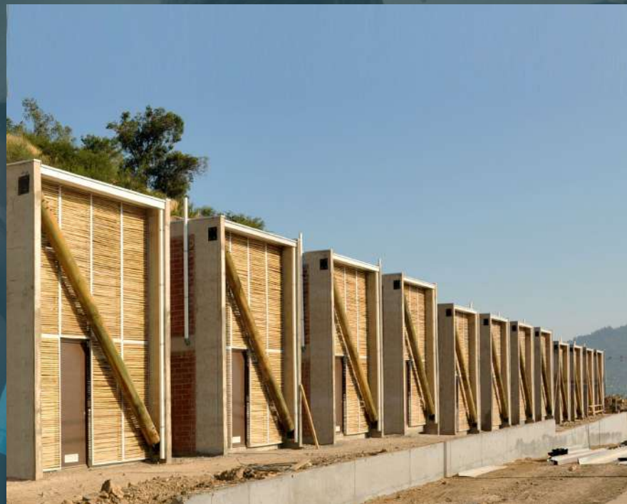
Conjunto de viviendas Mapuches. Desarrollo en Santiago de Chile: gobierno, constructora y TECHO.