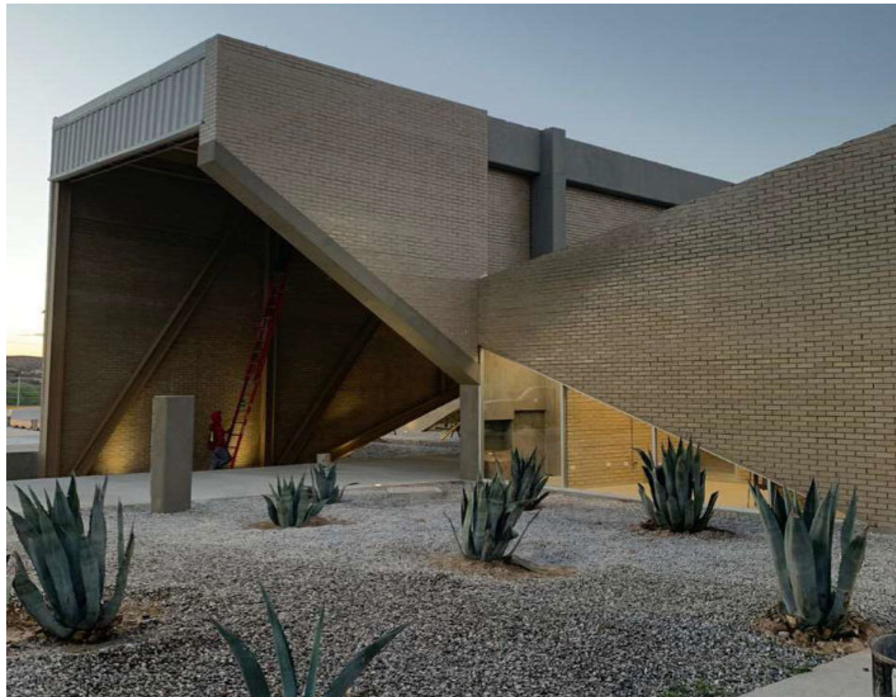
Polideportivo La Montada Ciudad Juárez, Chihuahua.