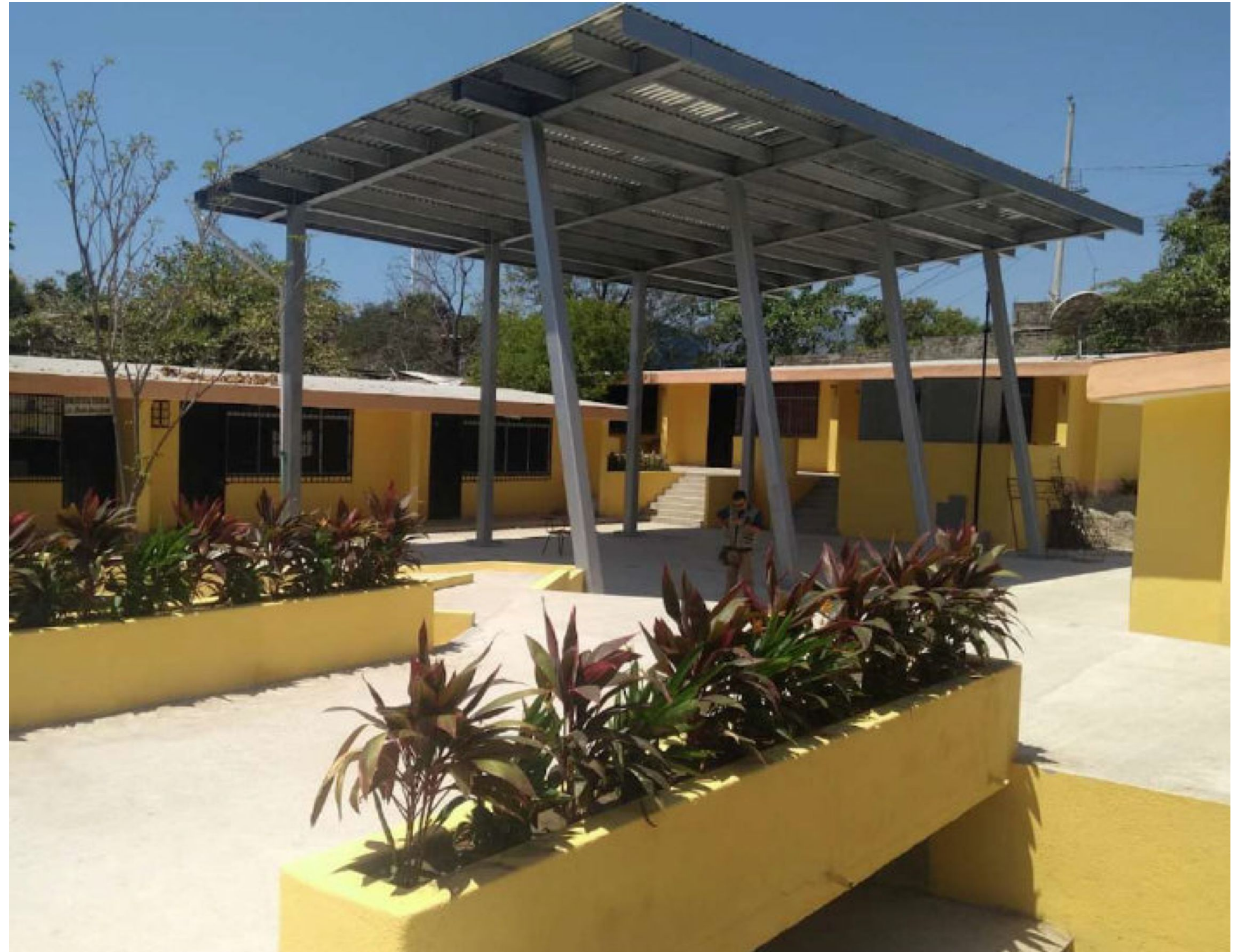
Escuela Primaria Aquiles Serdán Acapulco, Guerrero.