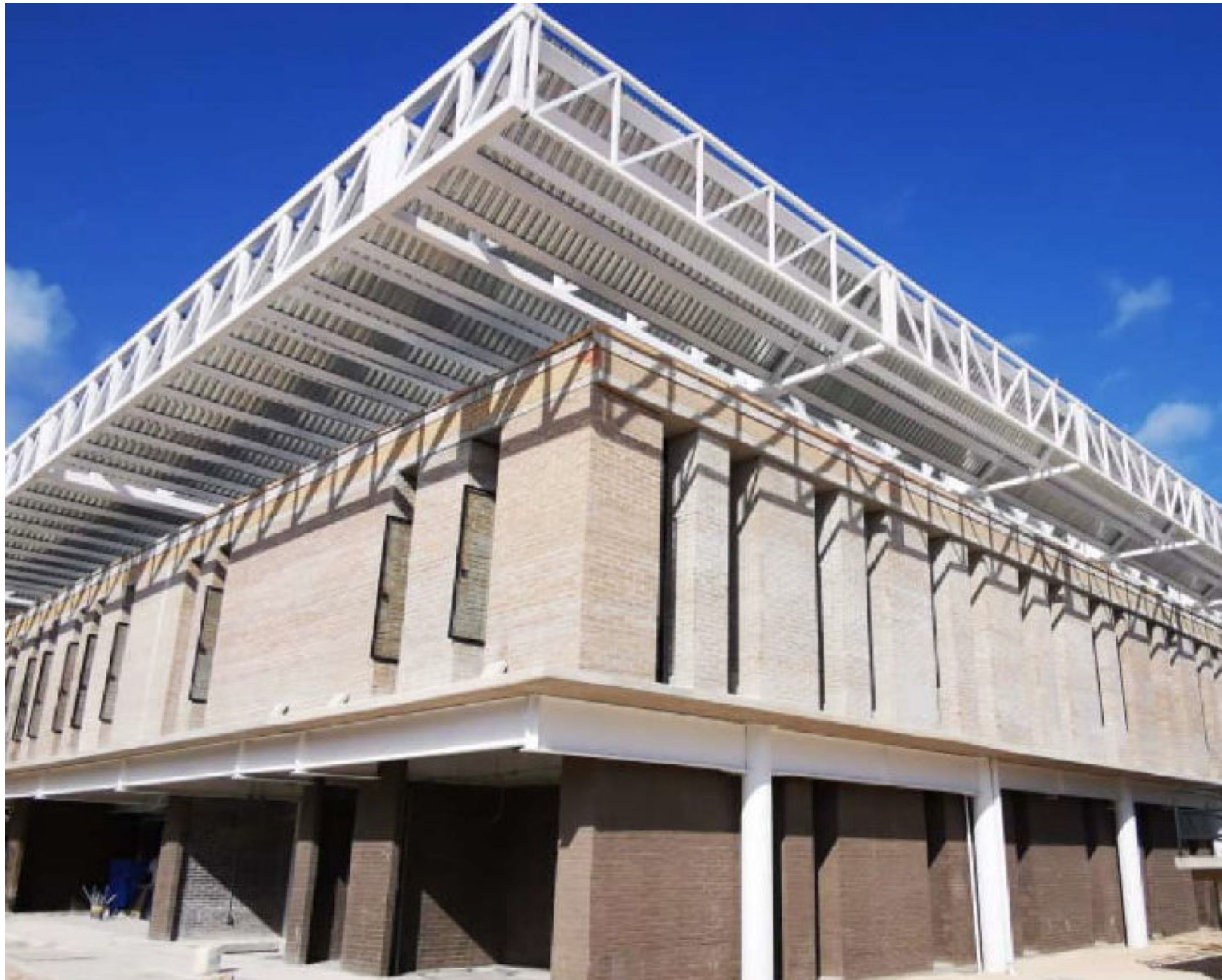
CRIM Solidaridad, Quintana Roo.