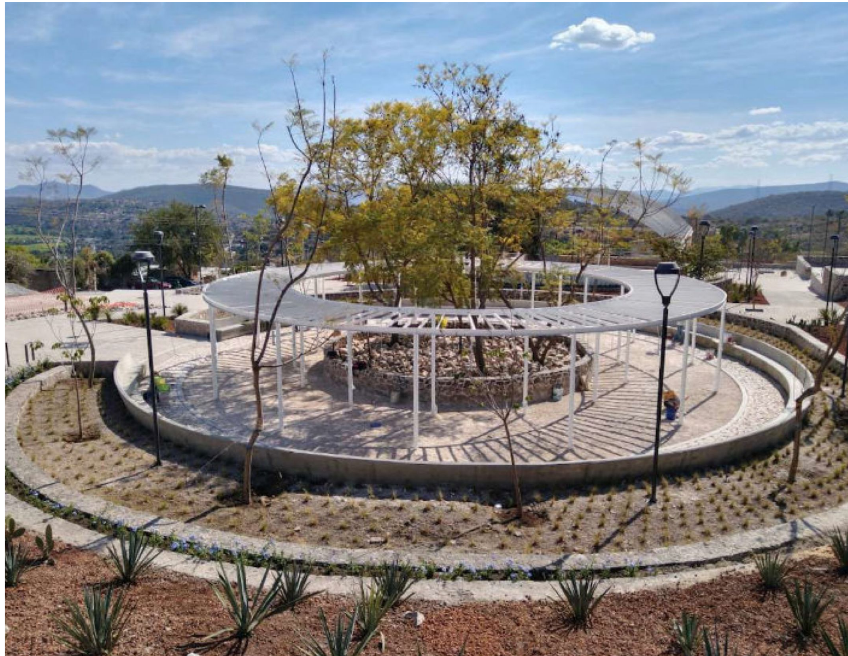
Polideportivo La Capilla Ayala, Morelos.