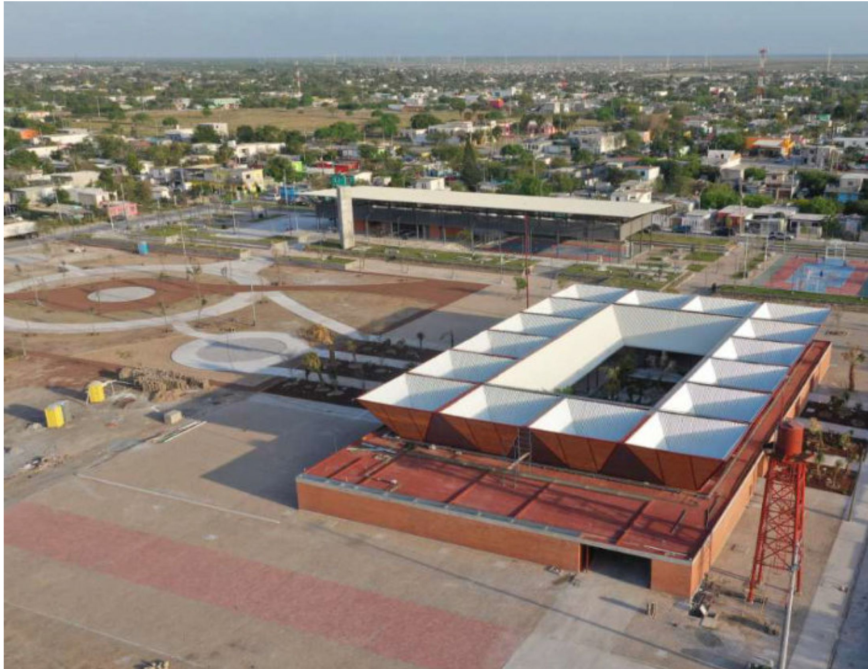
Mercado Público Solidaridad. Matamoros, Tamaulipas.