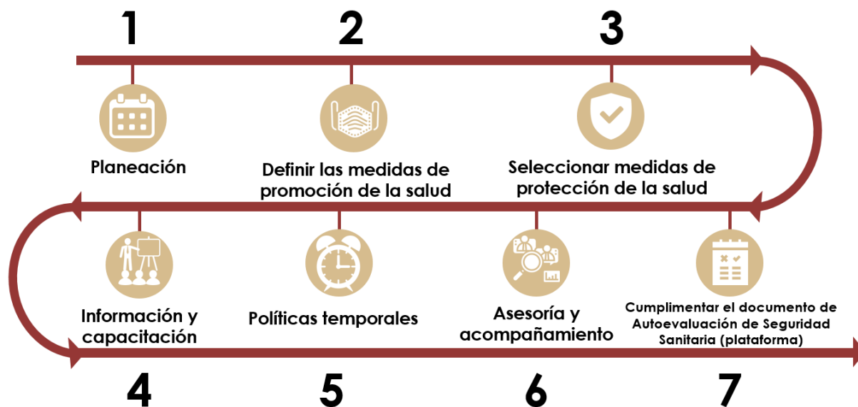
Diagrama 3. Pasos para establecer los Protocolo de Seguridad Sanitaria

Debe recordarse que, dependiendo de su ubicación, muchos centros de trabajo deberán continuar con la suspensión de actividades, tomando en cuenta las instrucciones de la autoridad sanitaria y las directrices incluidas en estos lineamientos.