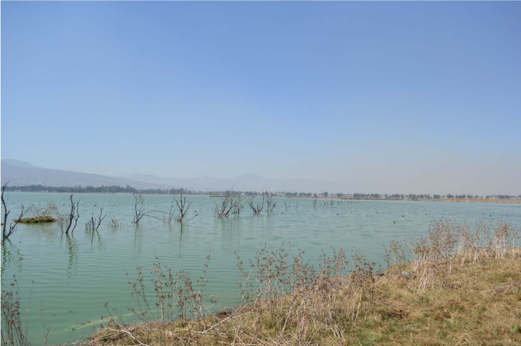
Humedal Tláhuac-Xico visto desde la zona de la Col. San José Tláhuac. 18 de febrero de 2020.