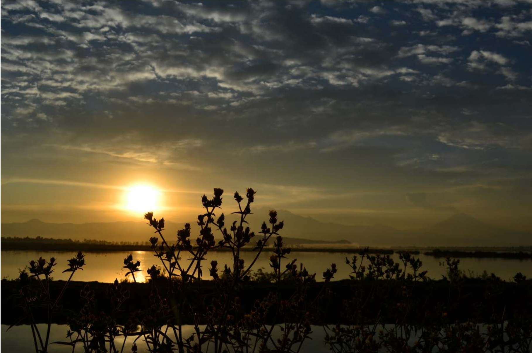
Amanecer en la laguna, humedal Tláhuac- Xico visto desde la colonia San José Tláhuac, 15 de marzo de 2020.