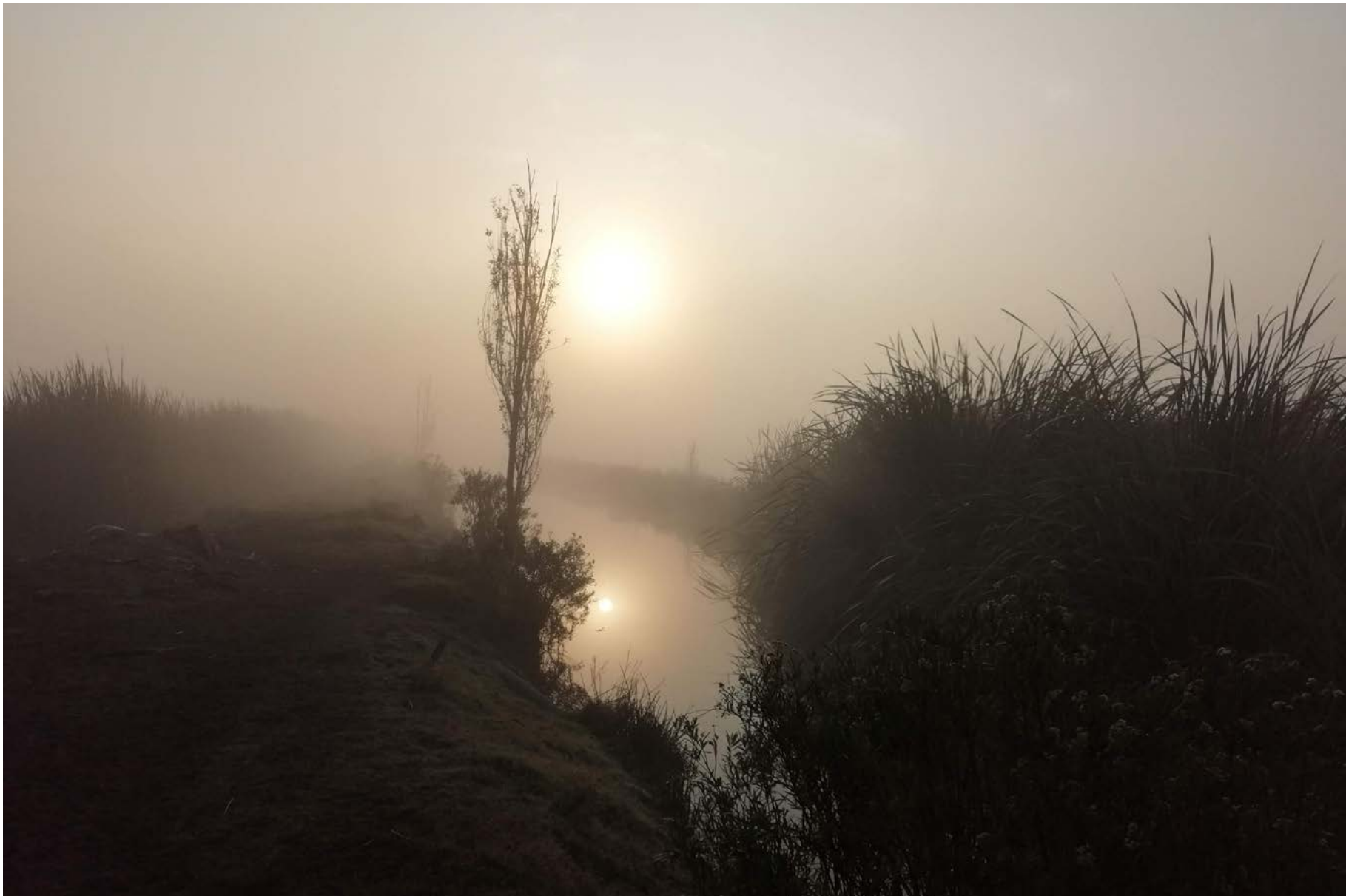
Tules y ahuejotes en la zona del ejido de San Pedro Tláhuac, 23 de diciembre de 2019.