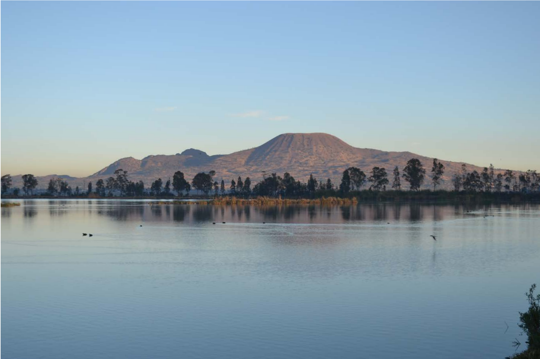
Sierra de Santa Catarina, carretera Tláhuac-Chalco y el humedal Tláhuac-Xico, 2 de febrero de 2020.