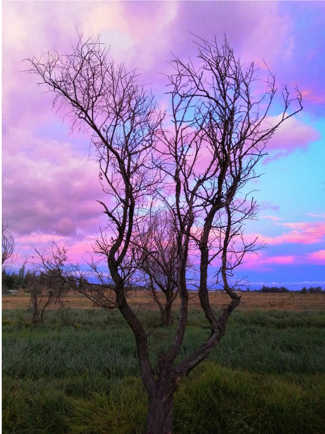
Amanecer en el Ejido de San Pedro Tláhuac, una mañana de diciembre, donde los contrastes del amanecer y el reflejo de las nubes cambia conforme transcurren los minutos. 15 de diciembre de 2019.