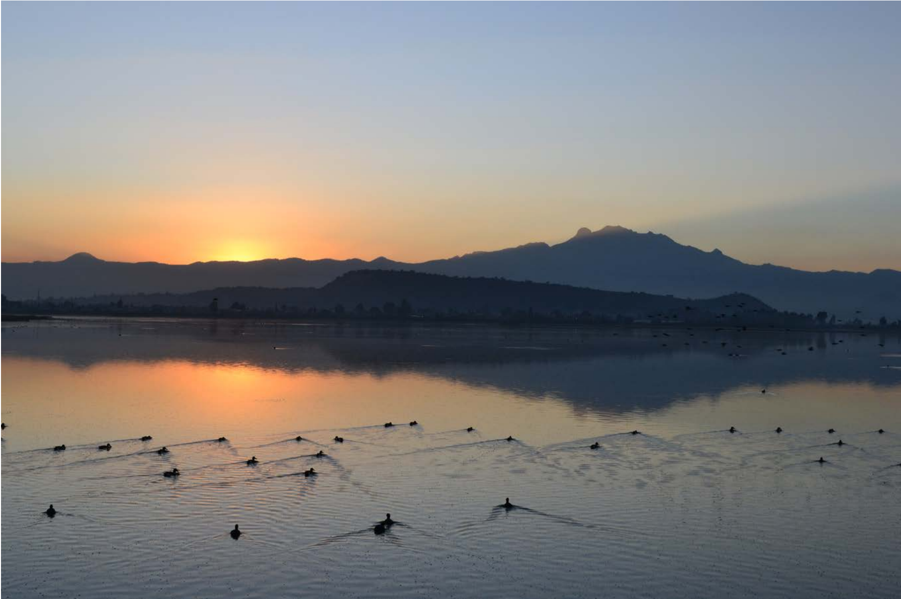
Batería de Pozos, Ejido de San Pedro Tláhuac, Pato Cucharón Norteño y Gallaretas en el humedal Tláhuac-Xico. 23 de marzo de 2020.