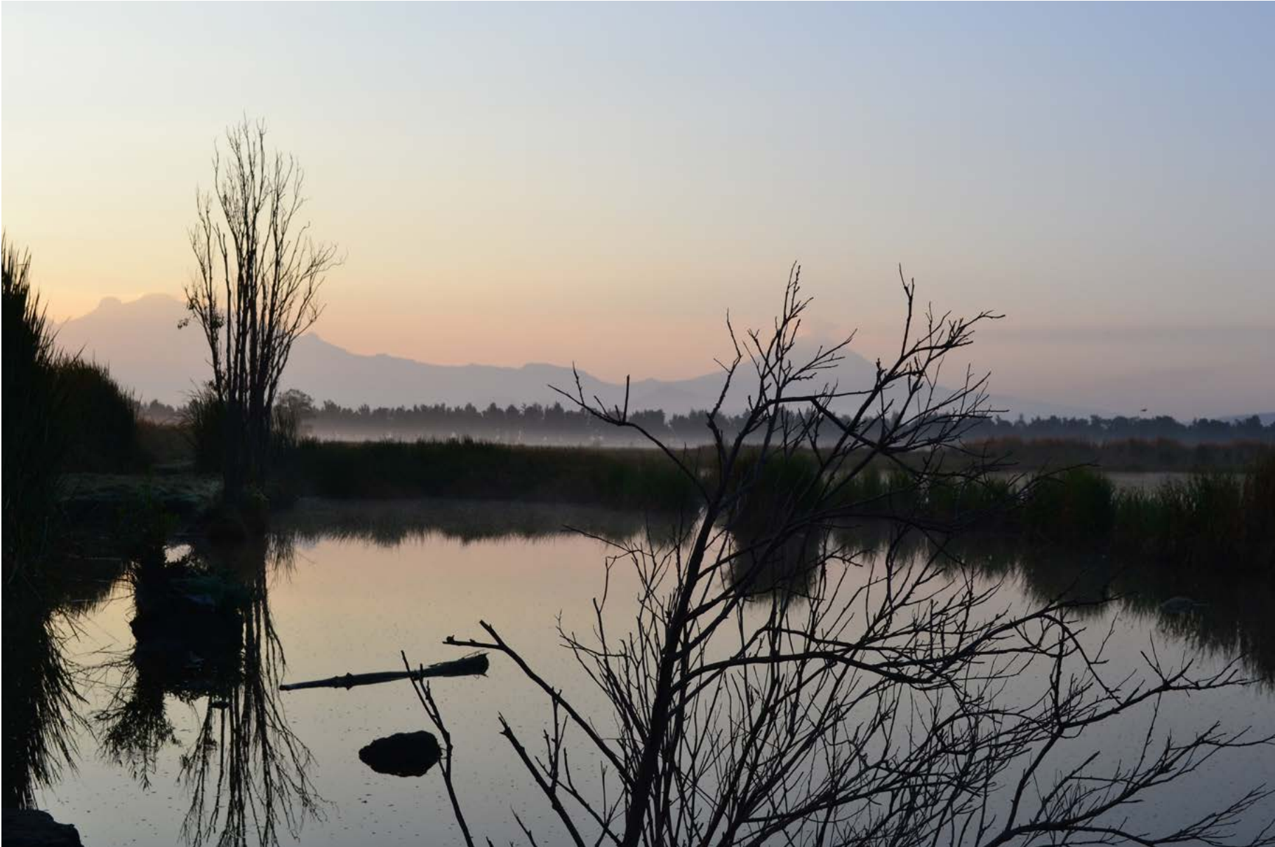
Volcán Popocatepetl y el humedal Tláhuac-Xico, 3 de abril de 2020.