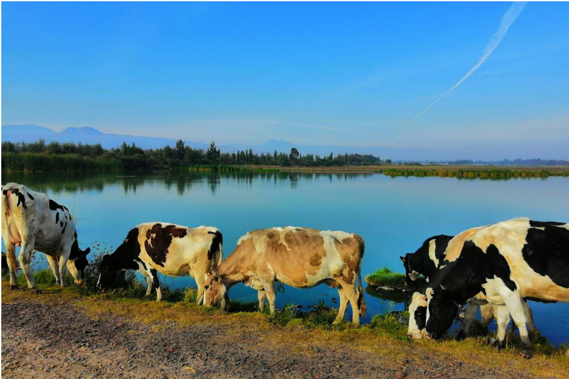
Vacas pastoreando en el ejido de San Pedro Tláhuac, 14 de noviembre de 2019.