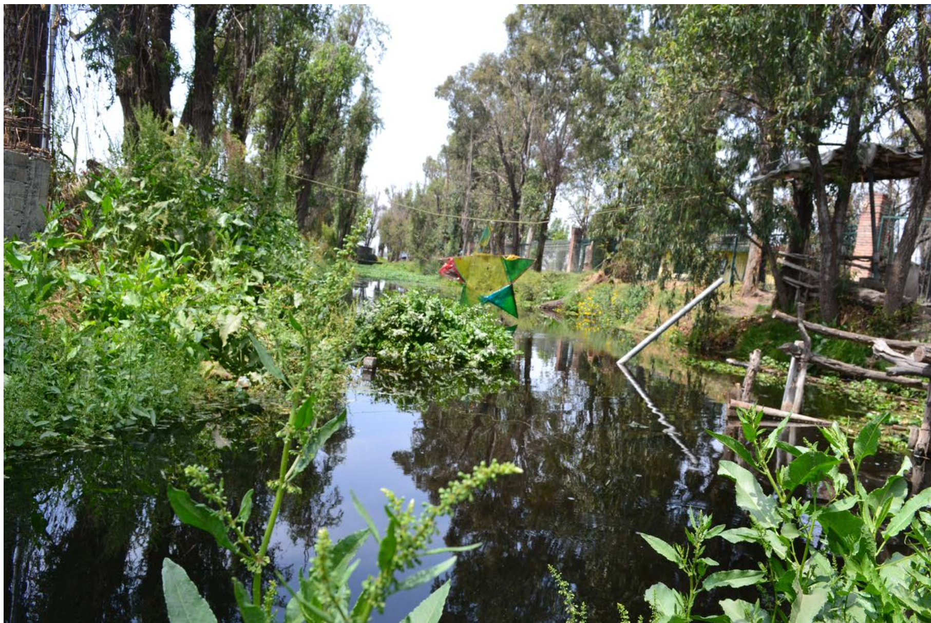
Canal Nacional, zona chinampera de San Pedro Tláhuac, 24 de enero de 2020.