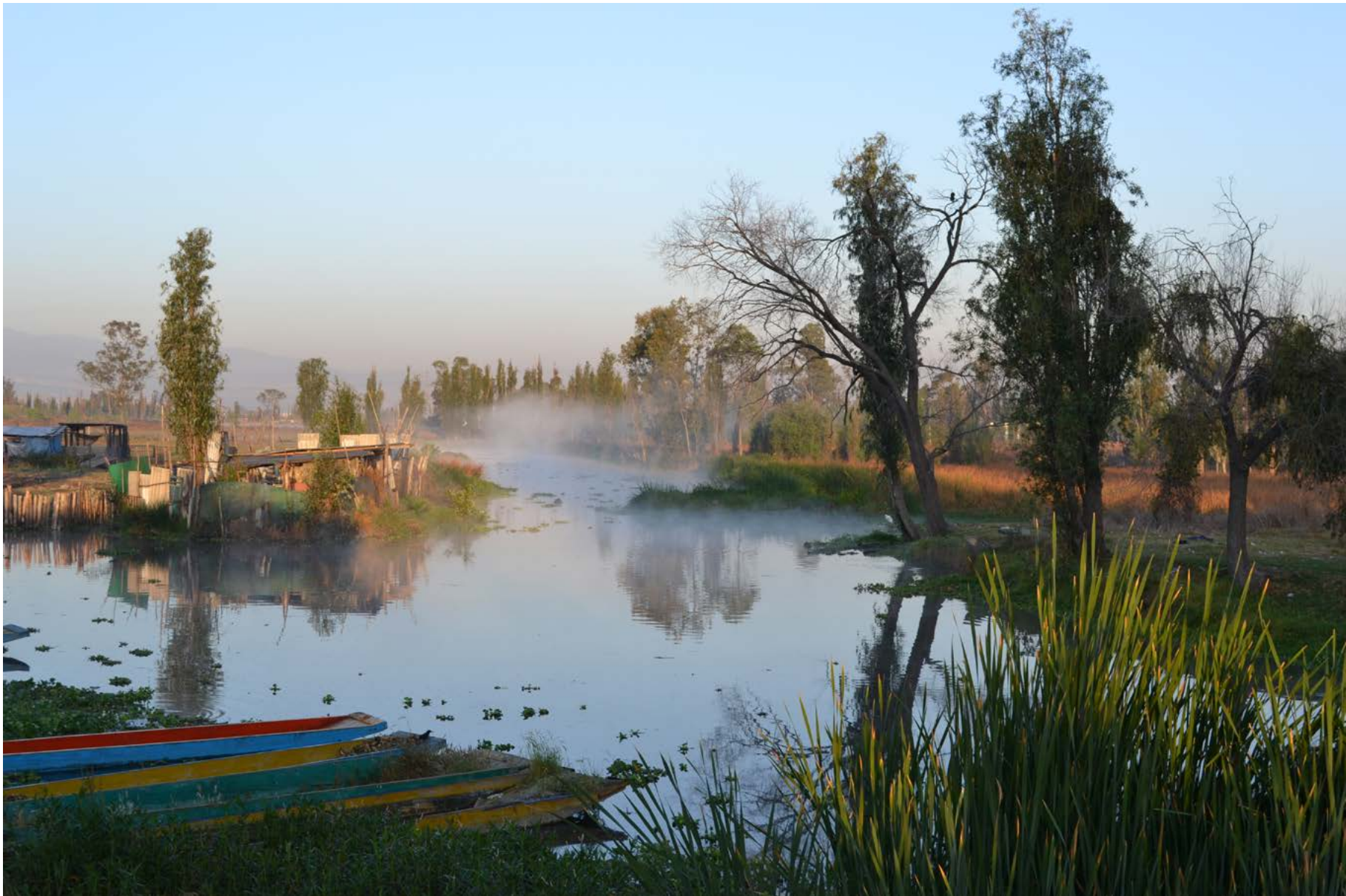
Canal Guadalupanaco en la zona chinampera de San Pedro Tláhuac, 7 de marzo de 2020.