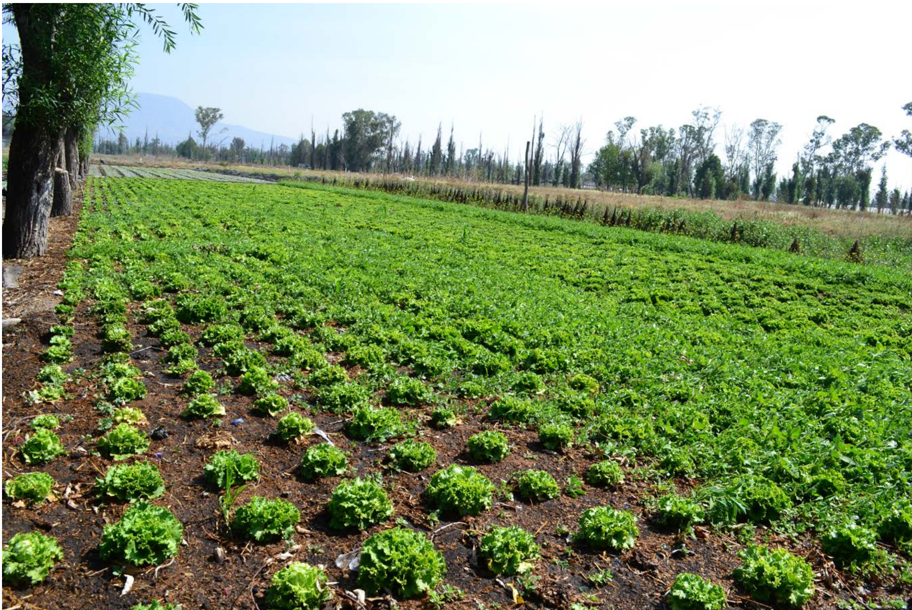
Ciénega de Tláhuac, Cultivo de lechuga orejona, 30 de marzo de 2020.