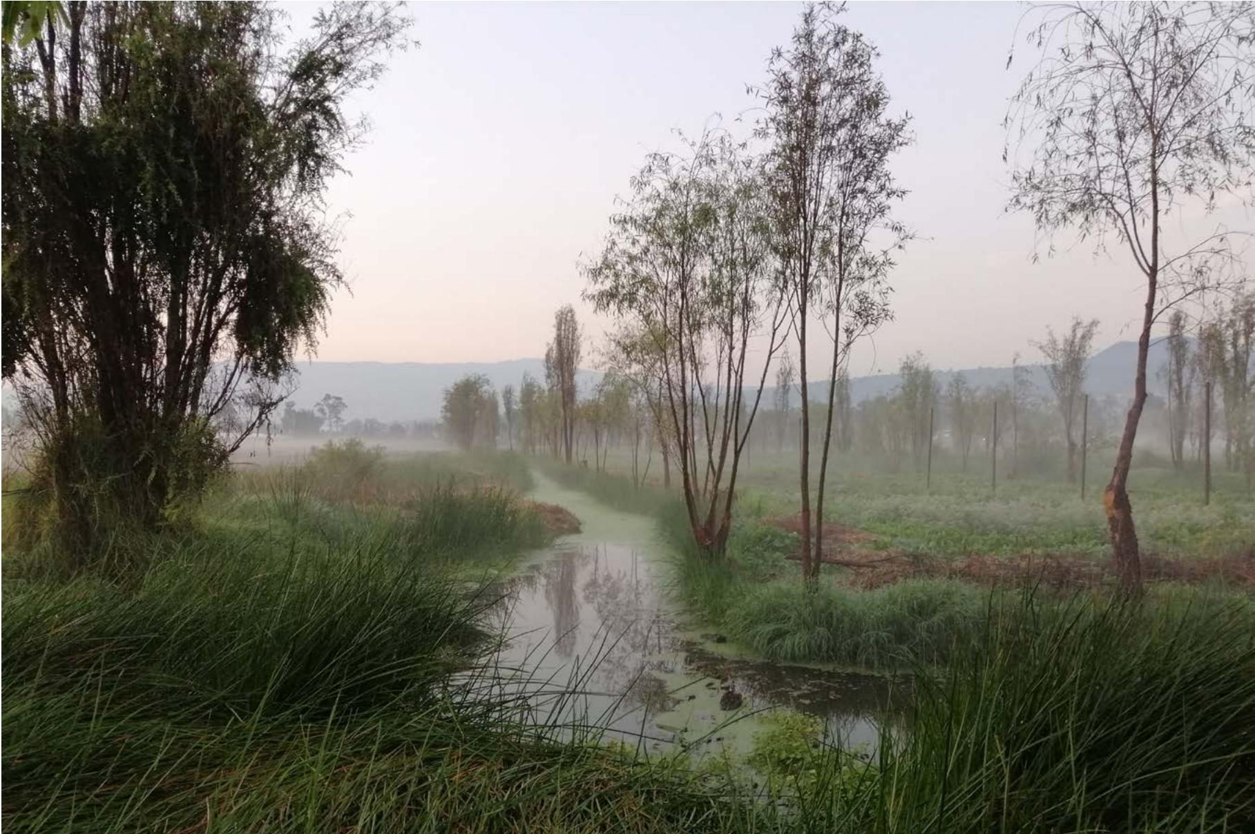
Zona ejidal de Santiago Tulyehualco, colinda con los extensos ejidos del pueblo de San Pedro Tláhuac, 10 de noviembre de 2019.