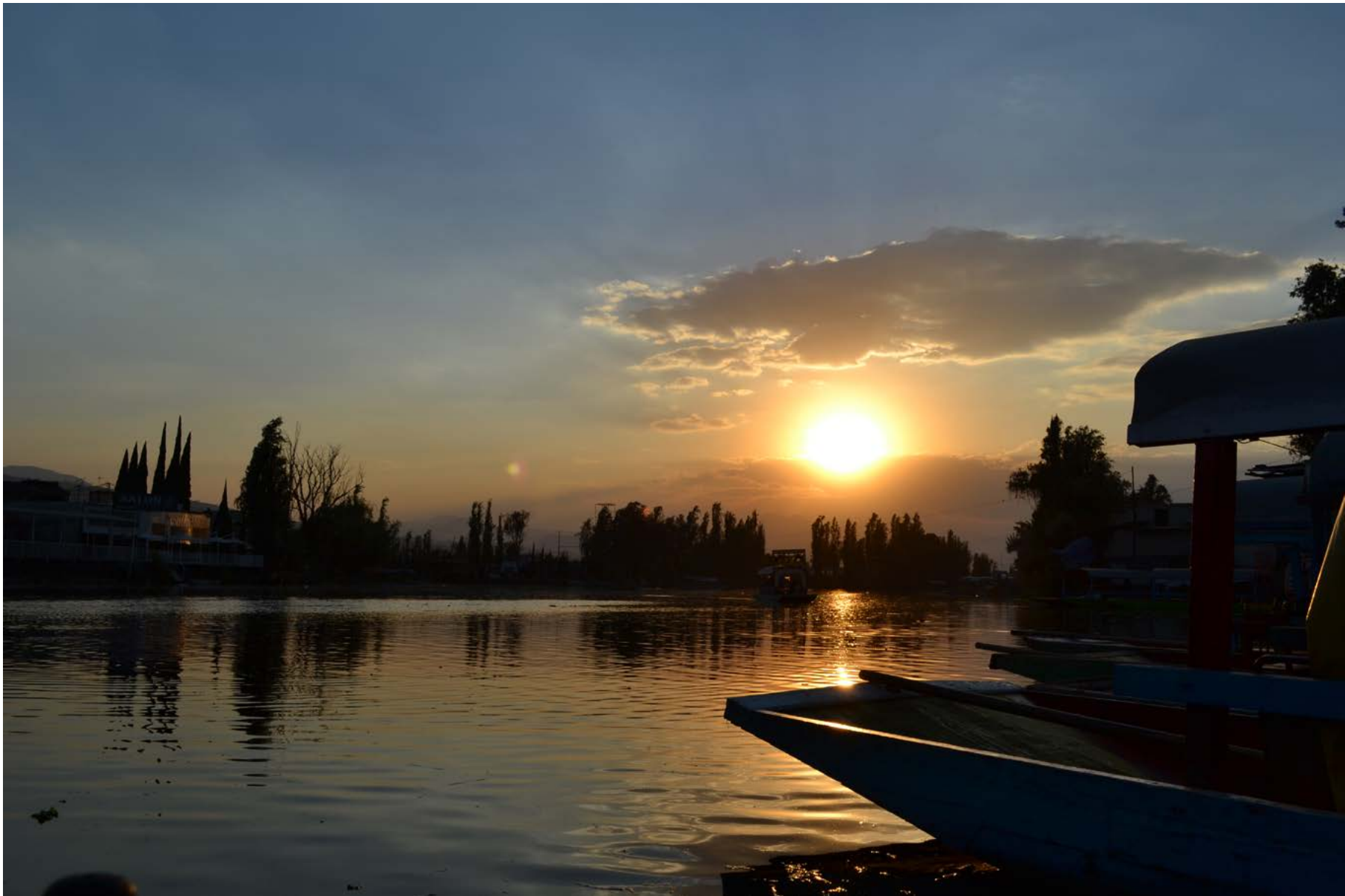
Embarcadero Lago de los Reyes Aztecas, pueblo de San Pedro Tláhuac, 12 de febrero de 2020.