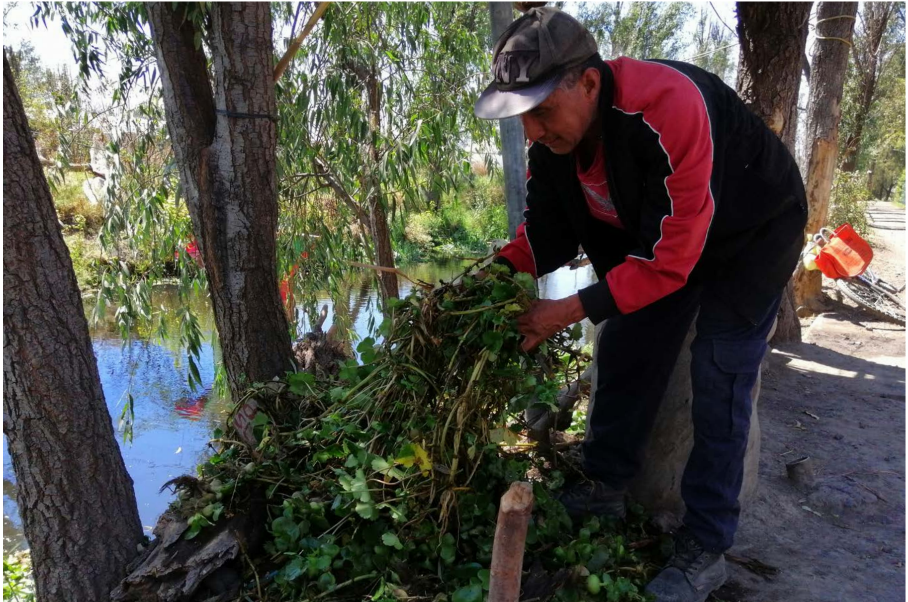
Extracción de huachinango en Canal Nacional, zona chinampera de San Pedro Tláhuac, 3 de marzo de 2020.