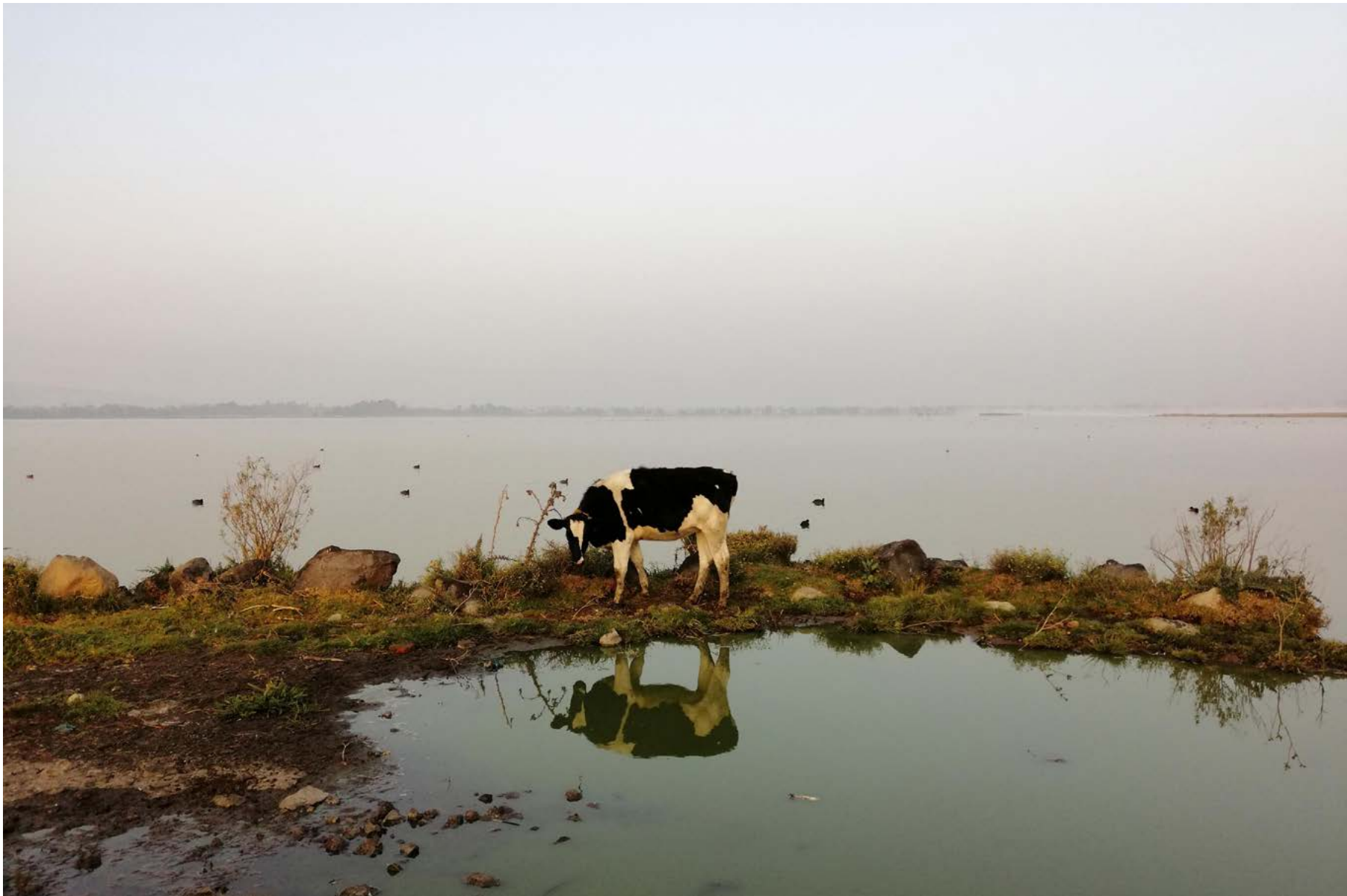
Ejido de San Pedro Tláhuac, Humedal Tláhuac-Xico. 23 de diciembre de 2019.