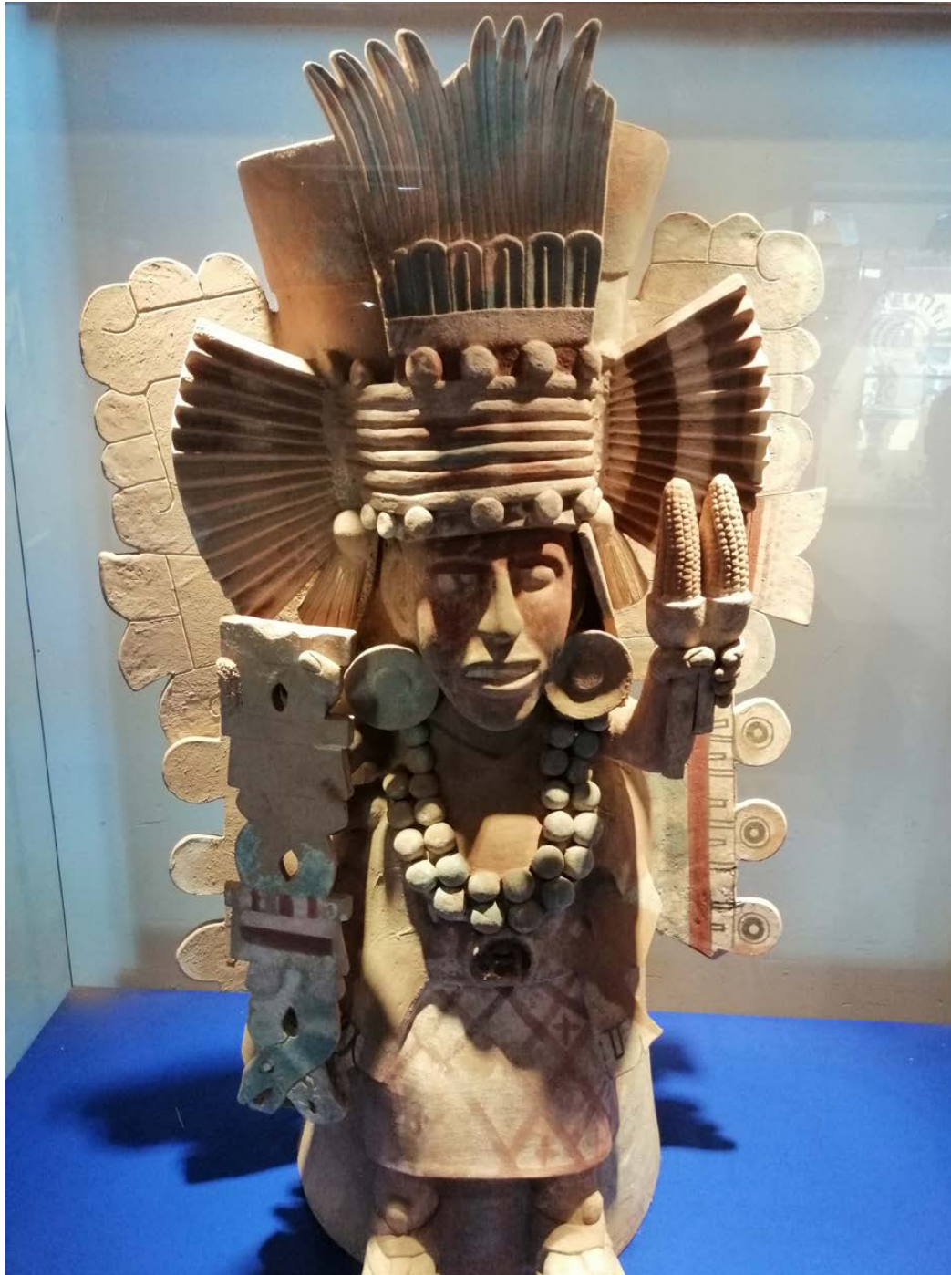
Museo Comunitario Regional Cuitláhuac, 30 de marzo de 2020.