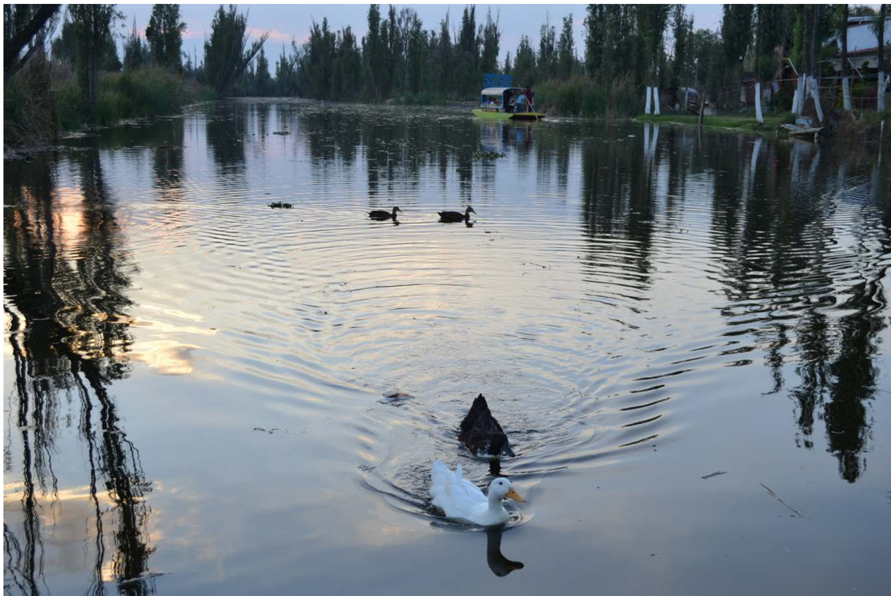
Lago de los Reyes Aztecas, San Pedro Tláhuac, 29 de febrero de 2020.