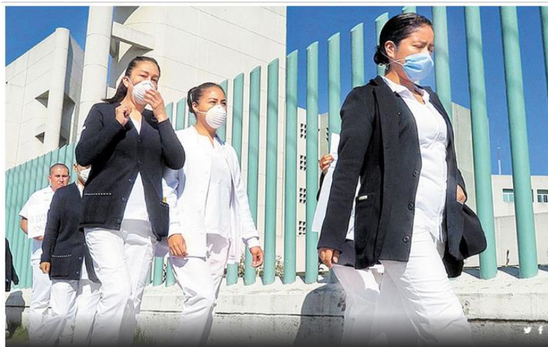
La policía reforzó la vigilancia en hospitales para evitar más ataques.

La Secretaría de Seguridad desplegó a más de 500 elementos en clínicas de cinco estados.