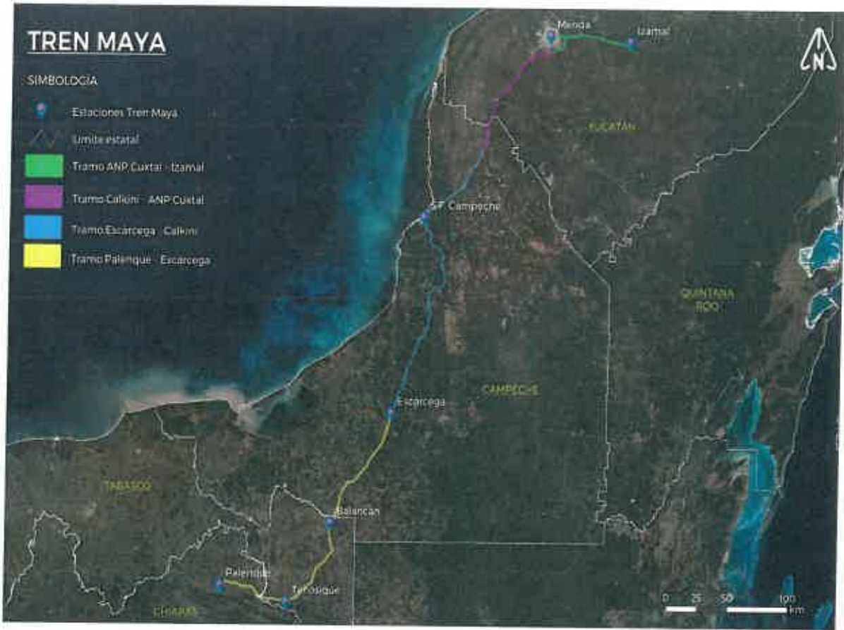
Figura 1.- Ruta del proyecto Tren Maya - División Administrativa