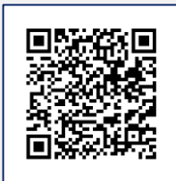
Infografía CENAPRED: “Qué onda con el calor”